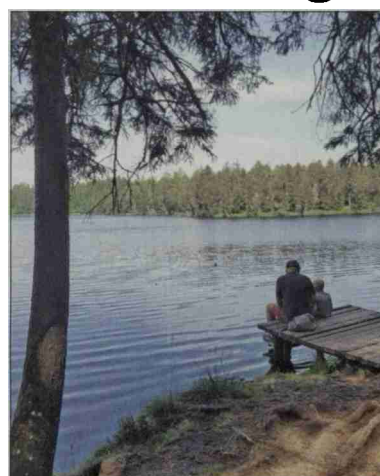
Un crédit de 500 000 francs sera soumis au vote des citoyens de Saignelégier pour financer des travaux à l'étang de la Gruère.

En attendant la mise en œuvre du plan spécial La Gruère et la construction des infrastructures d'accueil prévues (voir notre édition de mardi), des