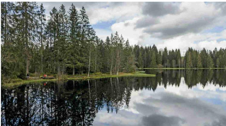
Les arbres sont devenus instables en raison du bostryche et des périodes de sécheresse.

Le débardage par hélicoptère est prévu à l'automne 2024, en même temps que d'autres interventions sur les sentiers bordant l'étang. Les travaux initiaux, agendés de lundi à mercredi prochain, seront effectués par une entreprise mandatée par la Commune de Saignelégier. Dans le détail, une cinquantaine d'épicéas asséchés par le bostryche et les différents épisodes de sécheresse seront abattus, «modifiant sensiblement le paysage».