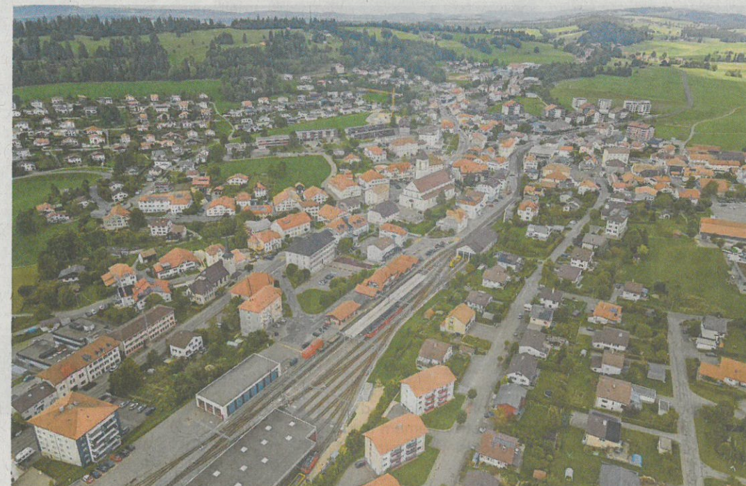
La commune avait prévu un crédit d'étude pour mettre plusieurs rues du village à 30 km/h, mais il a été supprimé par une majorité des ayants droit.

Le règlement a suscité plusieurs questions dans l'assem-