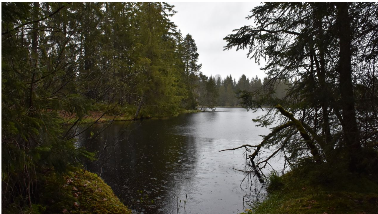
Une cinquantaine d'arbres instables abattus au bord de l'étang de la Gruère / Le Journal horaire / 14 sec. / aujourd'hui à 15:03