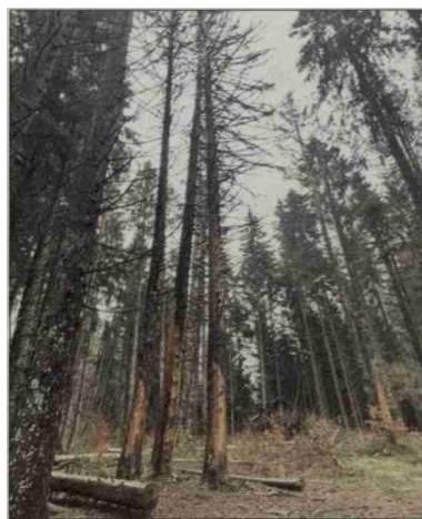
Ces opérations d'abattage sont prévues de lundi à mercredi.

Si le but de l'opération est de garantir la sécurité des visiteurs du site, les promeneurs seront appelés à la plus grande vigilance durant les travaux. Des sentinelles seront présentes