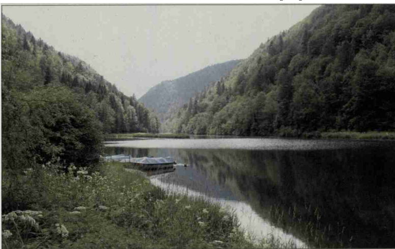
Le comité du Parc du Doubs a adopté la convention-programme 2025-2028.

L'OFEV rendra sa décision dans la deuxième partie de l'année prochaine. Le financement de la Confédération sera alors connu, de même que les prestations que le Parc naturel régional du Doubs devra réaliser durant la période de quatre ans de la convention-programme. LFM/mf